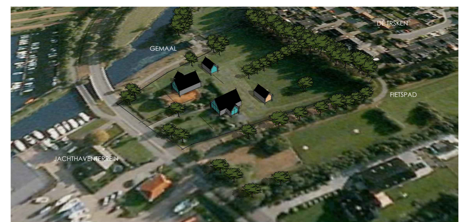
impressie mogelijke invulling / vogelvlucht 2