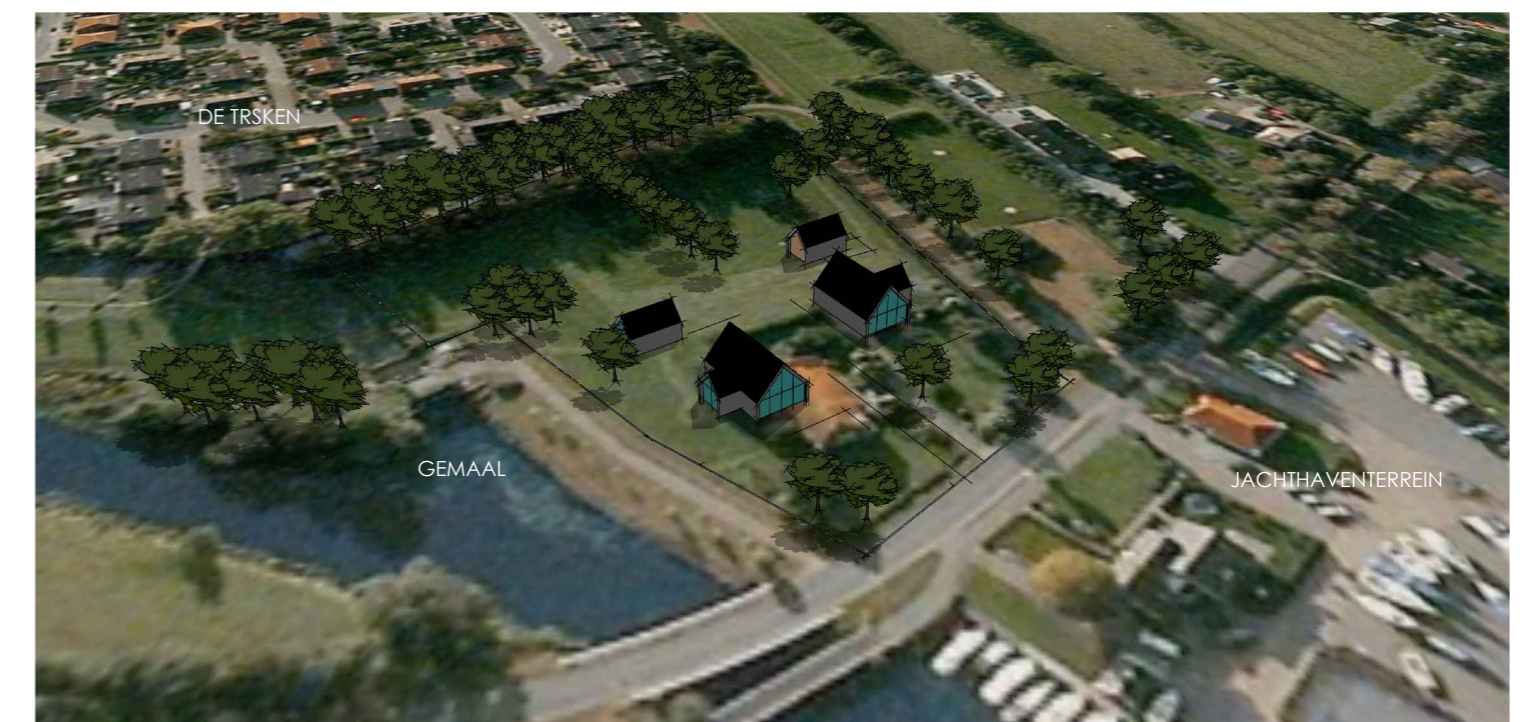
impressie mogelijke invulling / vogelvlucht 1